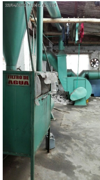
fotografia 8. DUCTOS DE DESCARGA de calderas