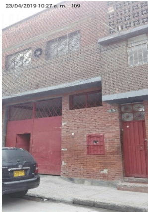
fotografía 1. FACHADA deL ESTABLECIMIENTO