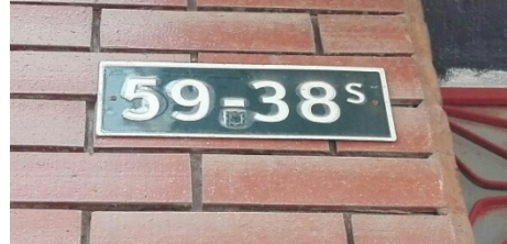
fotografía 2. Placa del Predio