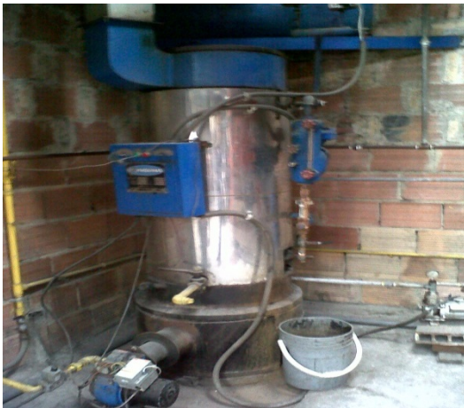
FOTOGRAFÍA 3: CALDERA COLMAQUINAS DE 10 BHP.