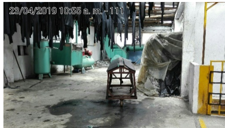
fotografía 4. ÁREA DE SECADO