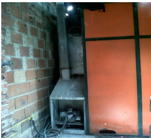
FOTOGRAFÍA 5: QUEMADOR DEL TOGLY.