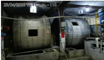
fotografía 3. BOMBOS (fULONES)