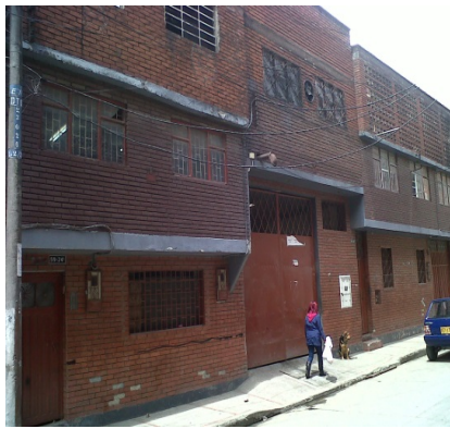
FOTOGRAFÍA 2: FACHADA DEL ESTABLECIMIENTO