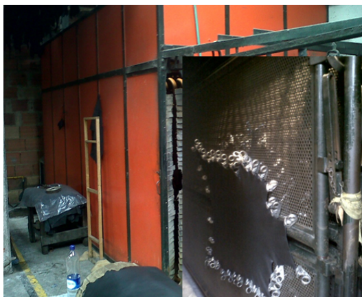
FOTOGRAFÍA 6: TOGLY PARA ESTIRAMIENTO DE LA PIEL.