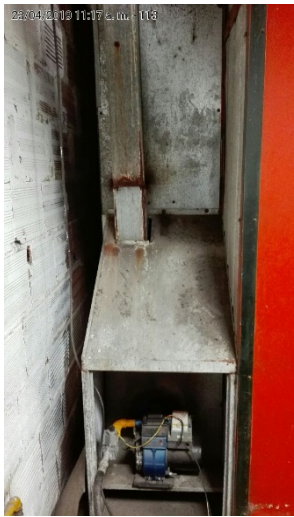
fotografia 5. QUEMADOR