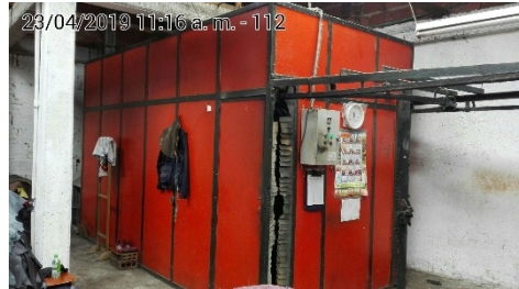
fotografia 6. HORNO TOOGLING