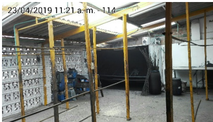
fotografia 7. Caldera desmantelada