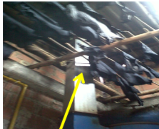
FOTOGRAFÍA 4: DUCTO DE CONDUCCION EMISIONES DE LA CALDERA