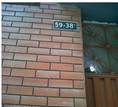
FOTOGRAFÍA 1: NOMENCLATURA.